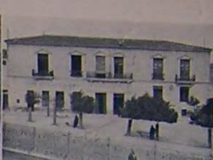
Casa Consistorial y Grupo escolar Juanes Leizola.