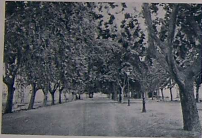
Avenida de San Onofre.

"BATALLA DE SAN ONOFRE.—Cien mil seiscientos hombres inexpertos y mal armados, mil soldados veteranos con tres cañones y cien caballos al mando del Brigadier Don José Caro,