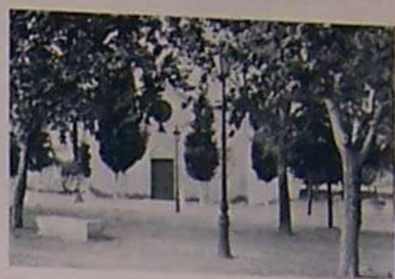
Ermita de San Onofre Patron de la Villa.